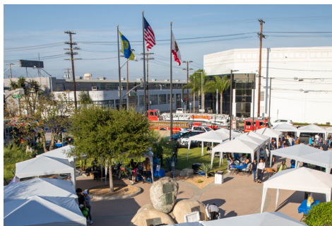
Tuvimos comida y obsequios gratis, y una exhibición de vehículos de emergencia.