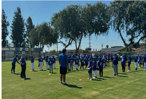
Los jugadores asistieron a una clínica gratuita de la Academia de los Dodgers.