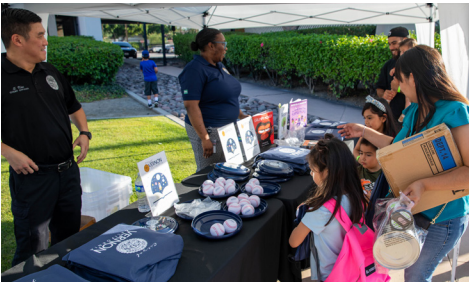
Distribuimos libros para las bibliotecas personales de los niños.