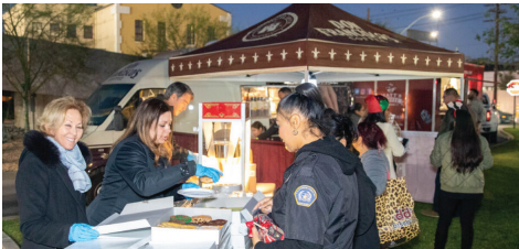
¡Todos disfrutaron de café, postres, paseos en trineo y regalos!