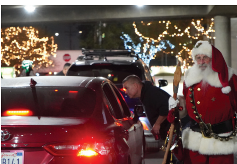
¡Santa y el Grinch sorprendieron a todos durante la entrega de regalos!