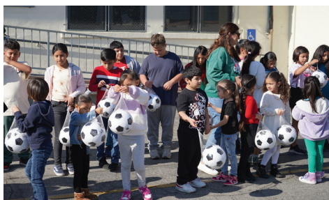
Los estudiantes de la Primaria Vernon recogieron sus nuevos balones de fútbol.