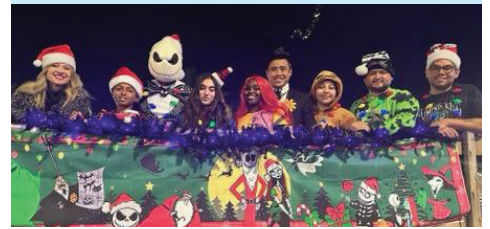
Los participantes se unieron a Huntington Park para el Desfile navideño anual.