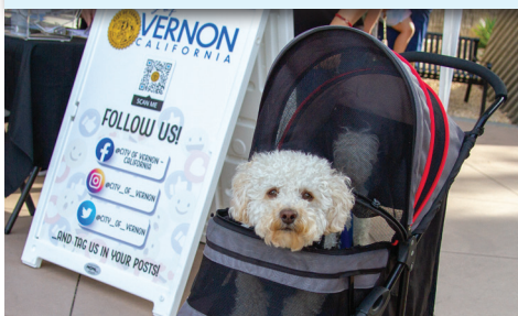
Inicio de verano 9 de junio