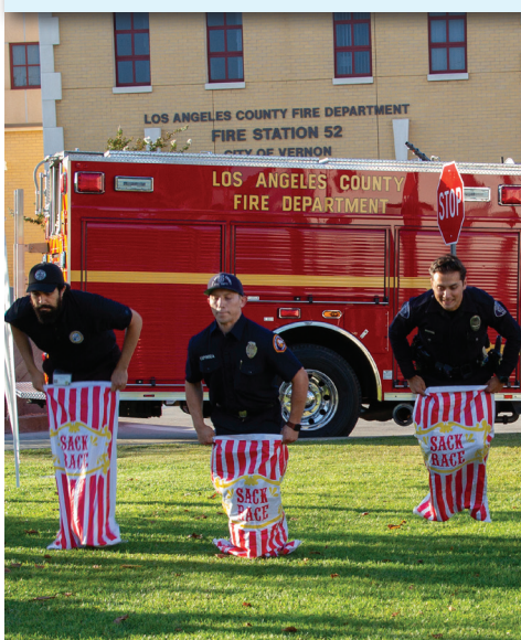
¡Los competidores de sacos de papas corren para ganar!