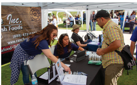
Feria de empleo de Vernon 23 de junio