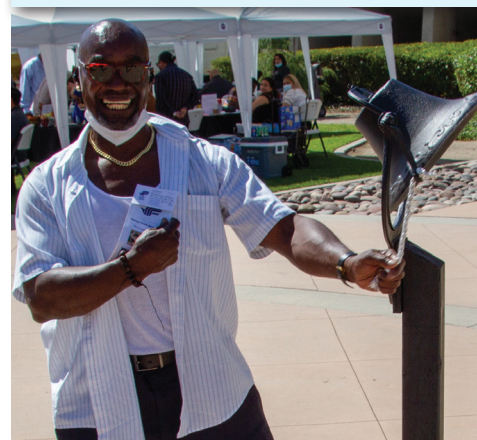
¡Trabajador con una nueva oportunidad suena el timbre!