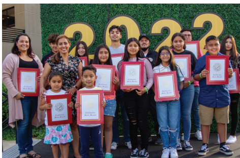
Los graduados de Vernon y los becarios reciben elogios.

Vernon regularmente organiza eventos para convivir con la comunidad. Recientemente, la Ciudad invitó a los residentes a la celebración de graduación y lanzamiento de verano, coordinó una feria de trabajo, y participó en National Night Out 2022, un evento especial para que los profesionales de seguridad pública convivan con todos ustedes. ¡A continuación se muestran algunas fotos de estos eventos! ¡Esperamos verte la próxima vez!